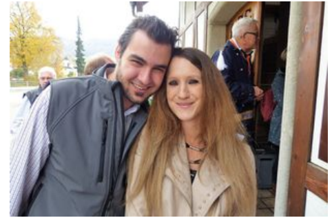
Martini-Chlapf in Wangen bei Olten